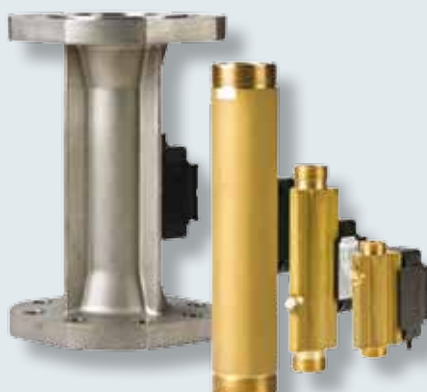
Flowmålere ULTRAFLOW® 54 qp 0,6 til 40 m 3 /h