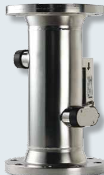
Flowmålere ULTRAFLOW® qp 60 til 1.000 m 3 /h